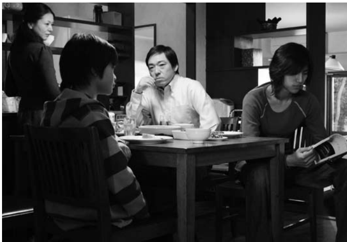
トウキョウソナタ